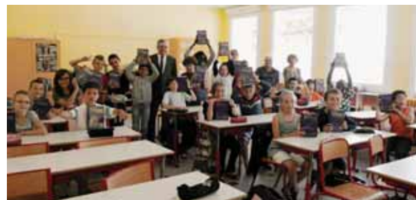
École élémentaire Fernand Léger

geste anodin, outre son importance culturelle, il permet aussi de favoriser l'égalité entre tous les élèves, car acheter un beau dictionnaire est un investissement que toutes les familles ne peuvent pas se permettre.