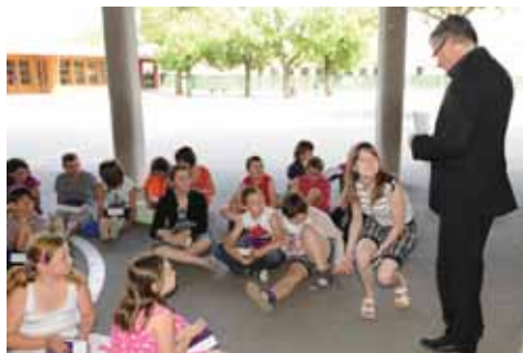
La CLIS (Classe pour l'Inclusion Scolaire)

adressé aux enfants et a rappelé la signification de ce geste : « tout au long de votre scolarité, ce dictionnaire sera pour vous un outil