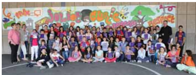
École élémentaire Joliot Curie, devant la fresque

de travail indispensable. Il sera aussi un compagnon utile tout au long de votre vie ». En guise de préface, un mot du maire invite les enfants à partir à la découverte des subtilités de la langue française. Offrir un dictionnaire n'est pas un