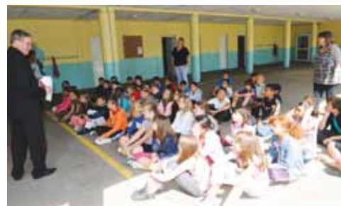
École élémentaire Voltaire

de travail indispensable. Il sera aussi un compagnon utile tout au long de votre vie ». En guise de préface, un mot du maire invite les enfants à partir à la découverte des subtilités de la langue française. Offrir un dictionnaire n'est pas un